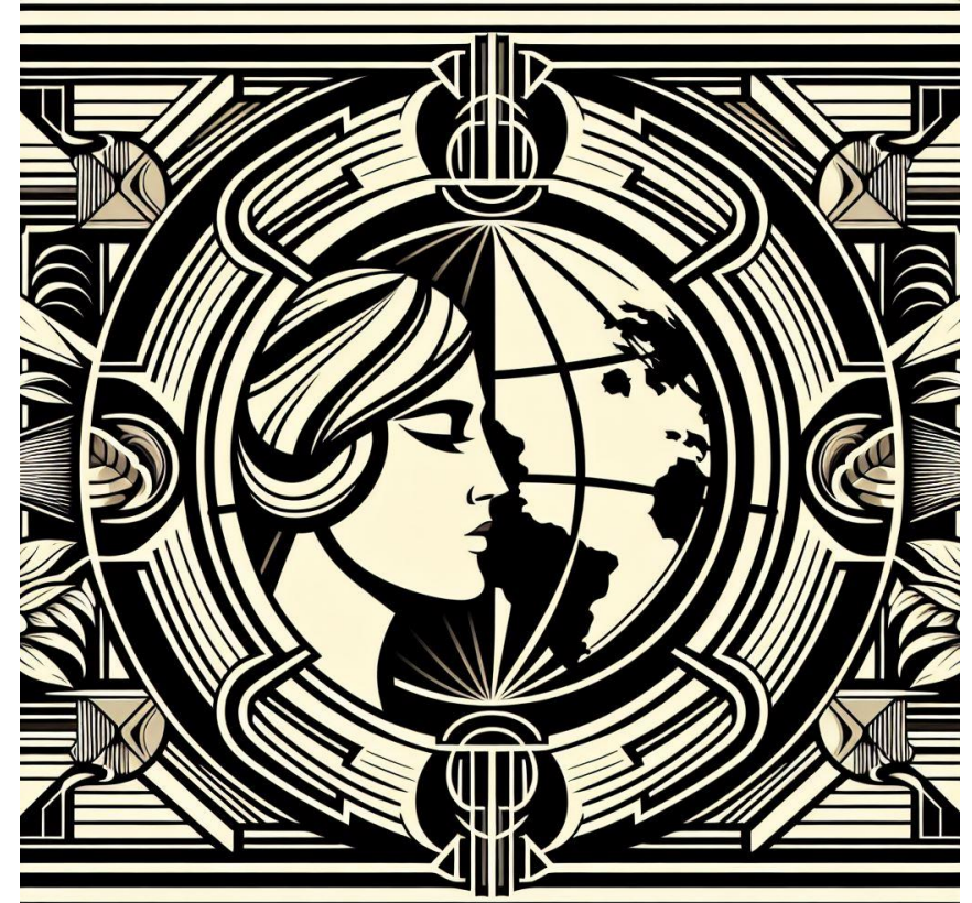
Kuva: Microsoft Copilot AI